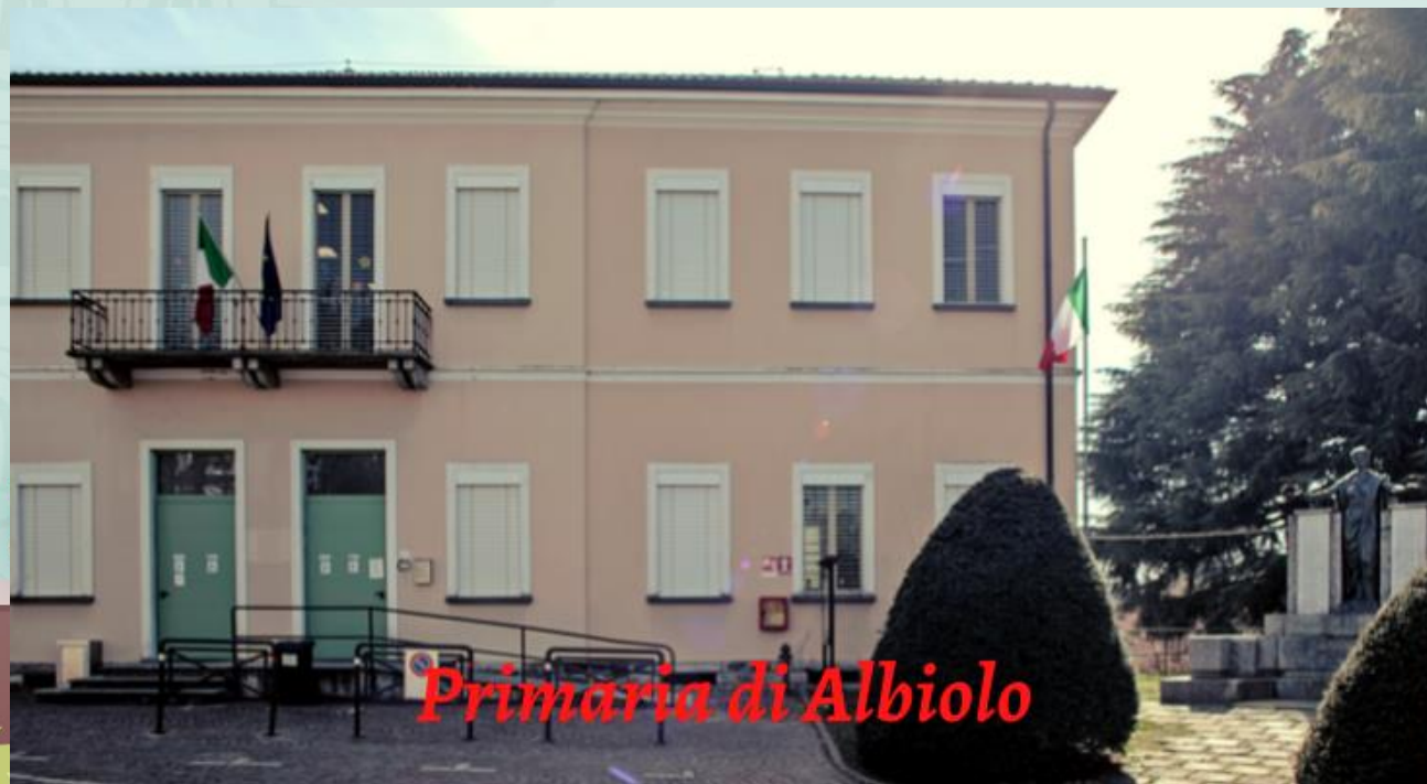
Primaria di Albiolo