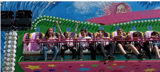
Après-midi libre avec les familles