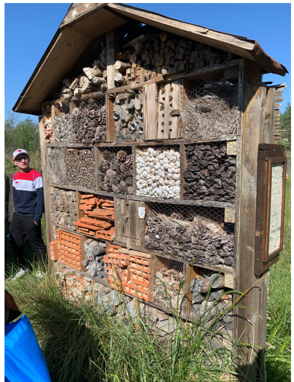
L'hôtel des insectes