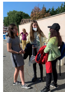
image 2 e 3 Premières rencontres des correspondants devant l'hôtel, quelle surprise!