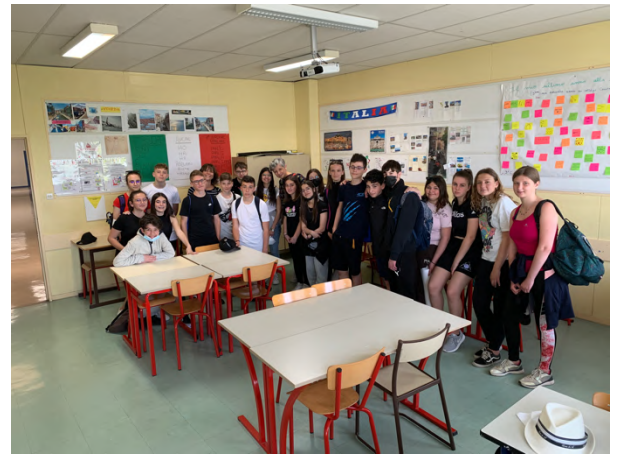
La salle de classe d'Italien